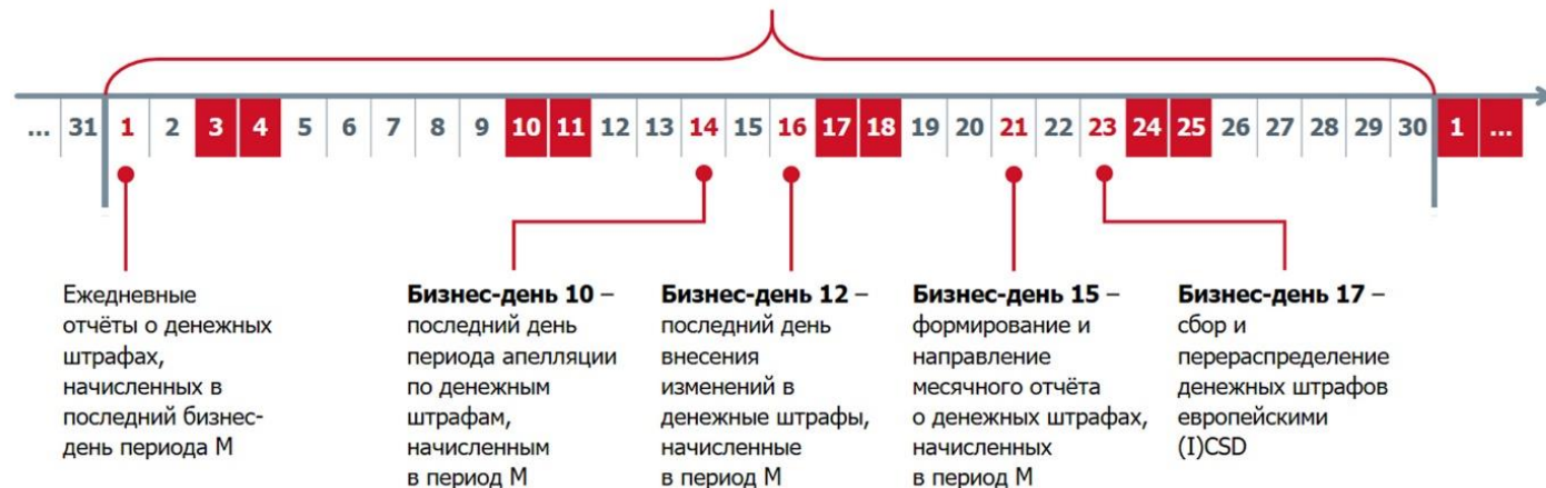
Ежедневные отчёты о денежных штрафах, начисляемых в период M+1

Примеры заполнения отчета будут предоставлены в течение 3 квартала 2021 г.