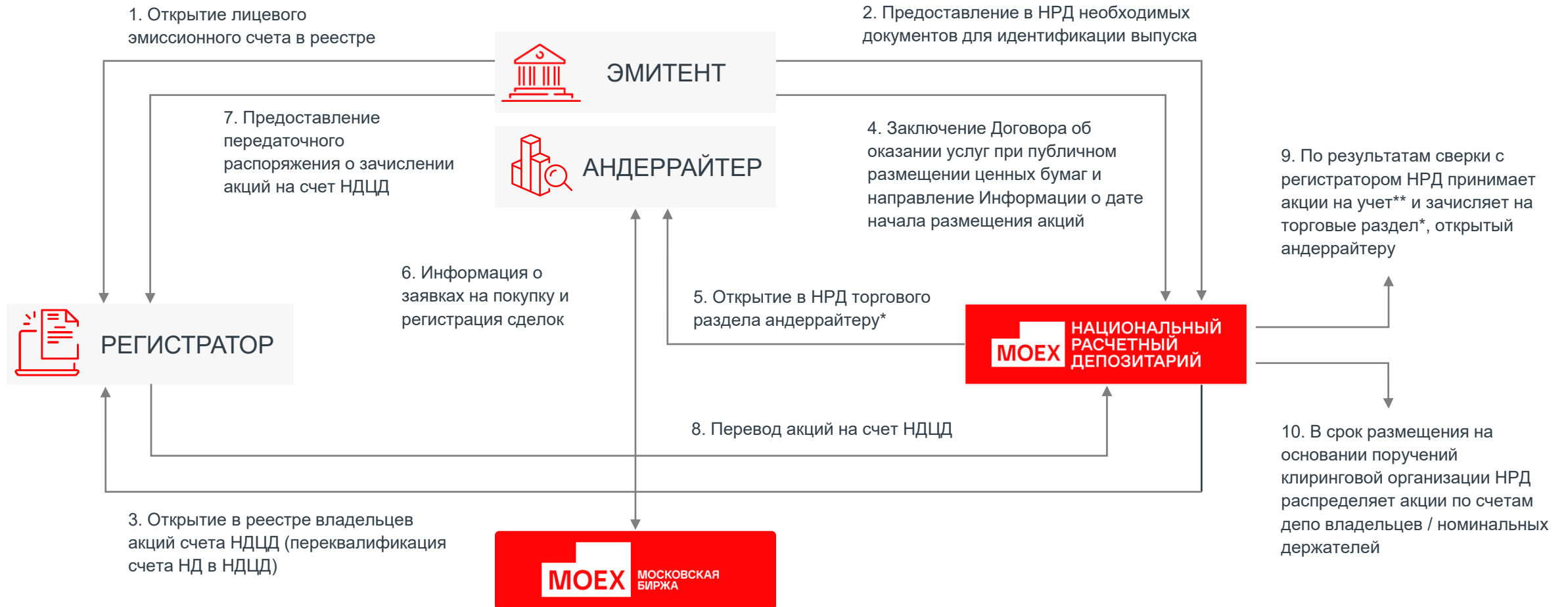
СХЕМА ВЗАИМОДЕЙСТВИЯ УЧАСТНИКОВ ПРИ ОКАЗАНИИ НРД ДЕПОЗИТАРНЫХ УСЛУГ ПРИ ПУБЛИЧНОМ РАЗМЕЩЕНИИ АКЦИЙ