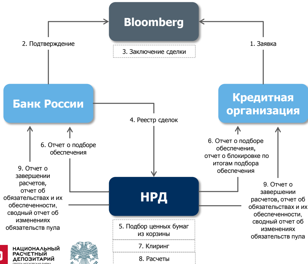
СХЕМА ПРОВЕДЕНИЯ РАСЧЕТОВ ПО ПЕРВОЙ ЧАСТИ РЕПО